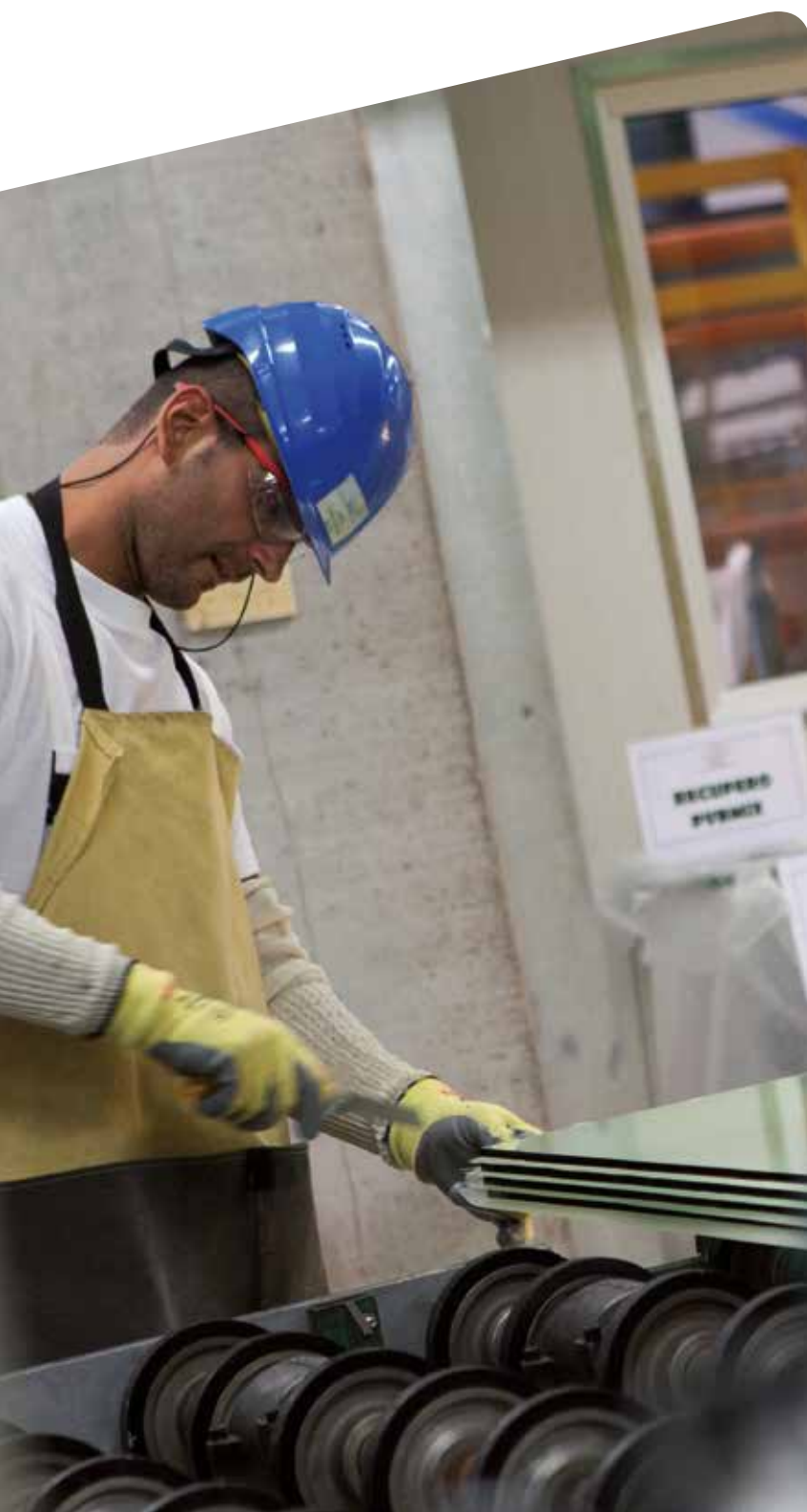
sgg STADIP®, sgg STADIP PROTECT®, sgg STADIP SILENCE®

Vetri stratificati di sicurezza: quando la protezione delle persone e dei beni si unisce alla trasparenza